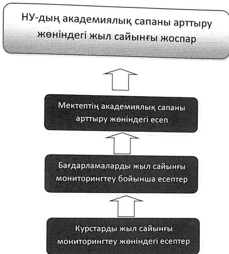
1-сурет. Есептілік құрылымы

Академиялық кеңеске бекітуге ұсынылатын НУ-дың сапасын арттырудың жыл сайынғы жоспарына енгізіледі.